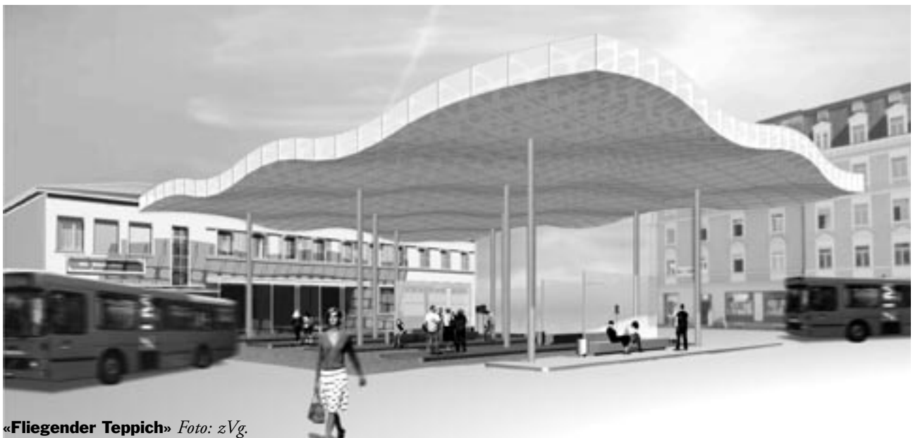
«Fliegender Teppich»