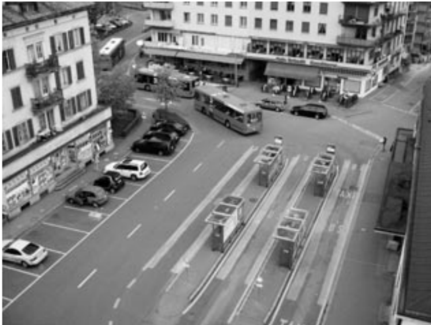
Bahnhofplatz 2006

Das Projekt Uster sieht den Abbruch des Güterschuppens vor. Der Güterschuppen befindet sich aber im Inventar der schützenswerten Bauten. Ein Abbruch ist nur für eine höherwertige Nutzung möglich. Buswarte- und Busabstellplätze stellen keine höherwertige Nutzung dar.