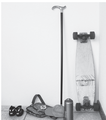
Durchmisches Wohnen hat Zukunft