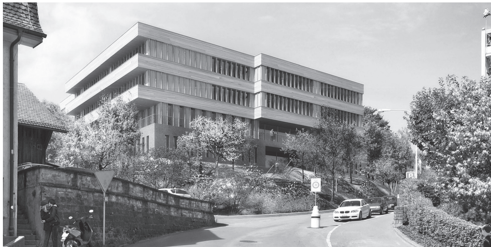
Visualisierung: Meletta Strebel Architekten

Das neue OSW-Schulhaus Rotweg soll die prekäre Platzsituation der Oberstufenschule in Wädenswil entschärfen.